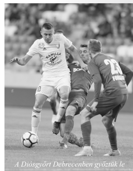
A Diósgyőrt Debrecenben győztük le