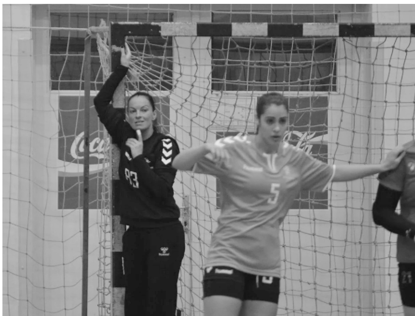
A csapat az utolsó pillanatig koncentrált, a jó játékot siker koronázta Hajdúnánáson. (Németi Ágnes és Juhász Renáta)