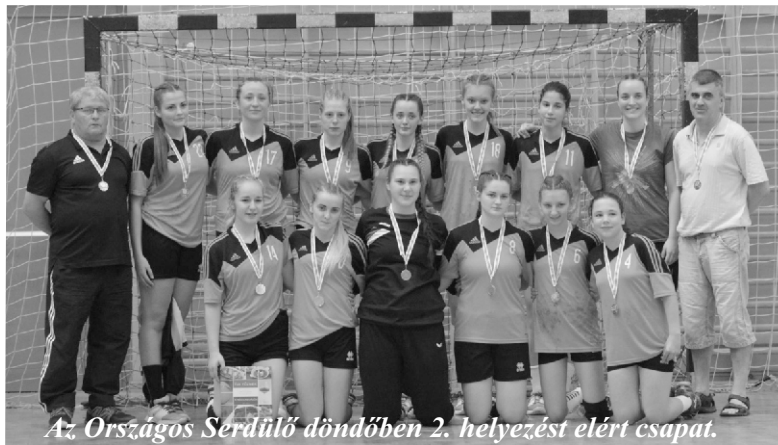
Az Országos Sérdülő döntőben 2. helyezést elért csapat.