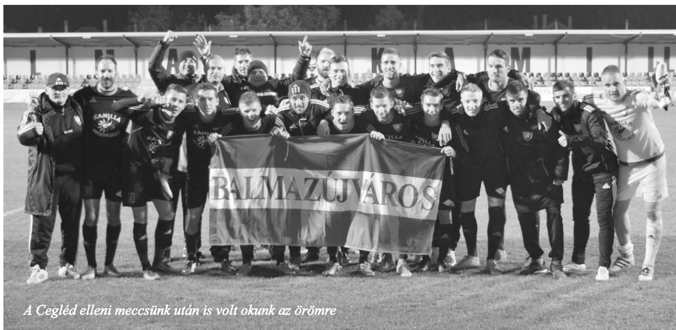
A Cegléd elleni meccsünk után is volt okunk az öröme

Ezt követően a válogatott miatt egy bajnoki szünet következett, melyet csapatunk egy felkészülési mérkőzéssel is kitöltött. Az NBI-es Loki a legerősebb összeállításban állt fel ellenünk, míg a mi szakvezetésünk több játékosunkat is pihentette.