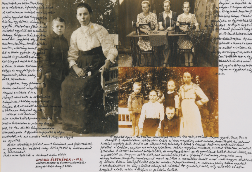
DARUSI ÉLETKÉPEK I-VI. L. KÉPES AZ 1920-AS ÉS 1930-AS ÉVEKBŐL.

38 évvel ezelőtt keletkezett az iskola. Egykor, amikor még nem volt a községünkben iskola, a 22 éves fiúgom... A daru-telep a Horthy-korszakban épült, a mai Balmazújváros egykori falurésze. A daru-telep a 1920-as években épült, a mai Balmazújváros egykori falurésze. A daru-telep a 1920-as években épült, a mai Balmazújváros egykori falurésze.