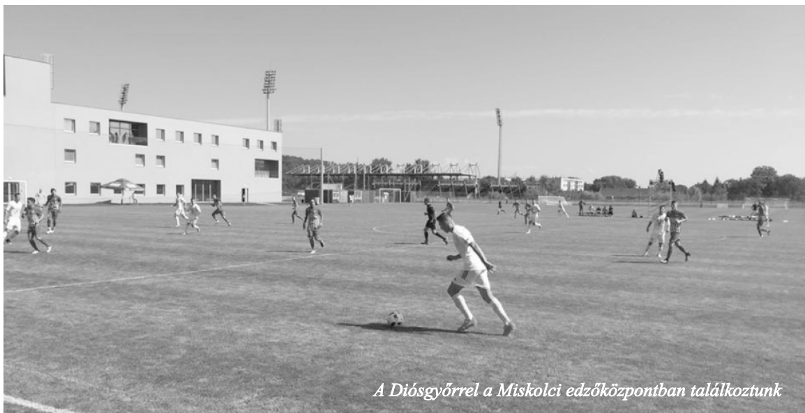
A Diósgyőrrel a Miskolci edzőközpontban találkoztunk