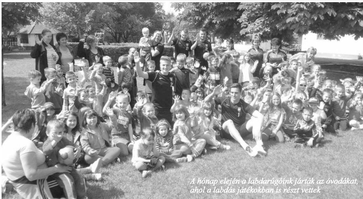
A hónap elején a labdarúgóink járták az óvodákat, ahol a labdás játékokban is részt vettek