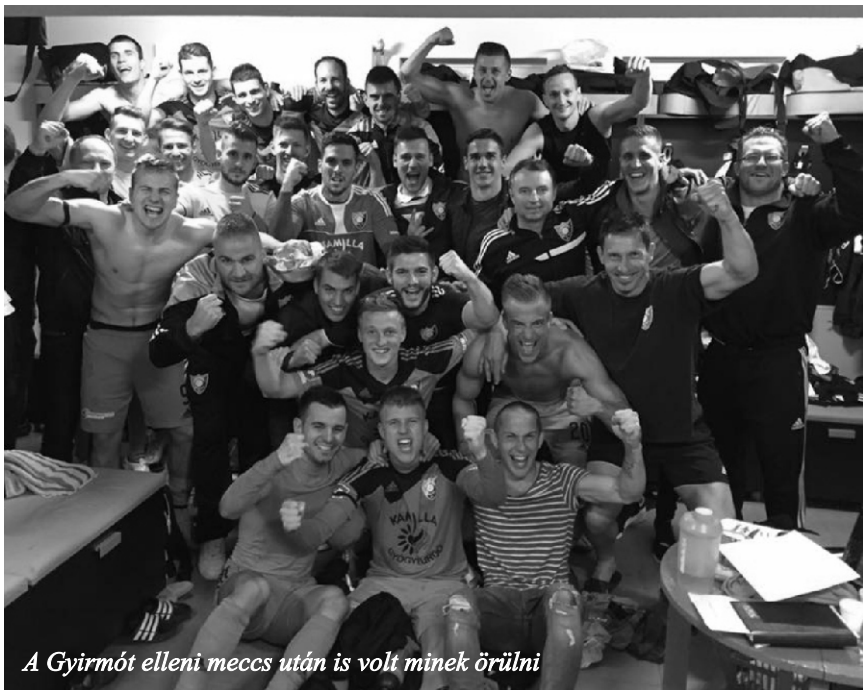
A Gyirmót elleni meccs után is volt minék örölm