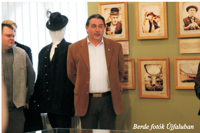
Berde fotók Újfaluban