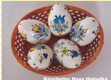
Készítette: Nagy Hajnalka