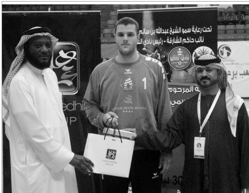
Bagi átveszi a mérkőzés legjobbjának járó díjat.

Január 11-én a Dubaji utat kipihenve kemény munkába fogott a Kőnig-Trade csapata. Hétfő déltől, péntek délelőtt 11-ig, 12 edzést letudva, egy közös ebéd elfogyasztása után, Szlovákia felé vették az irányt.