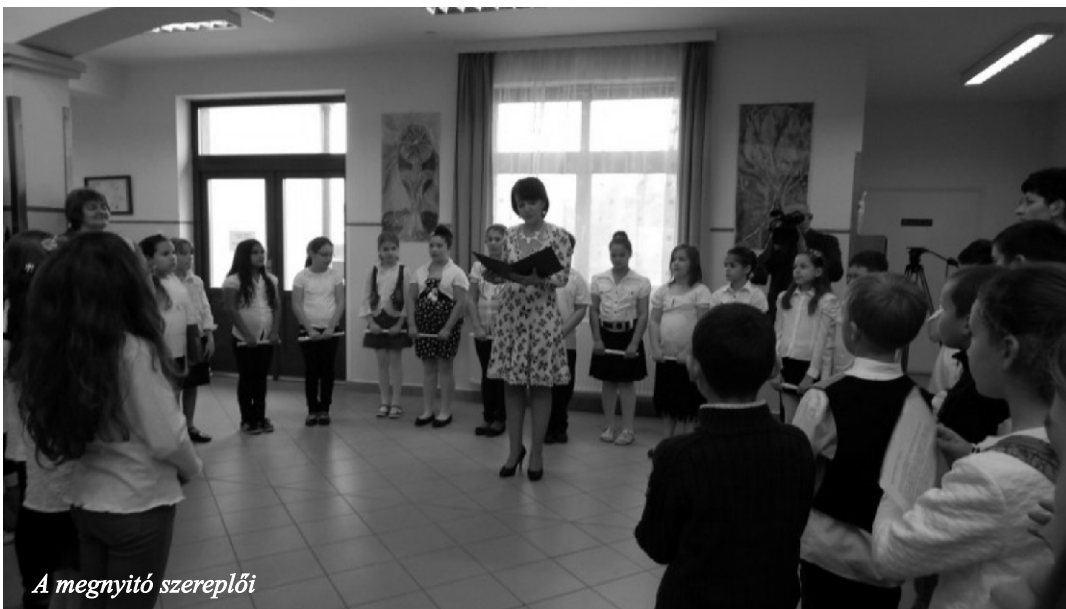
A megnyitó szereplői