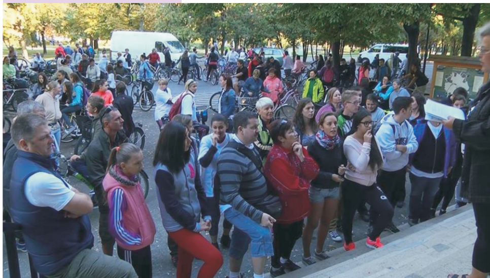
Indul a játék - menetlevél húzása

giája, pénze az embereknek, hogy a „magasabb kultúrát kínáló” eseményen is részt akarjanak venni.