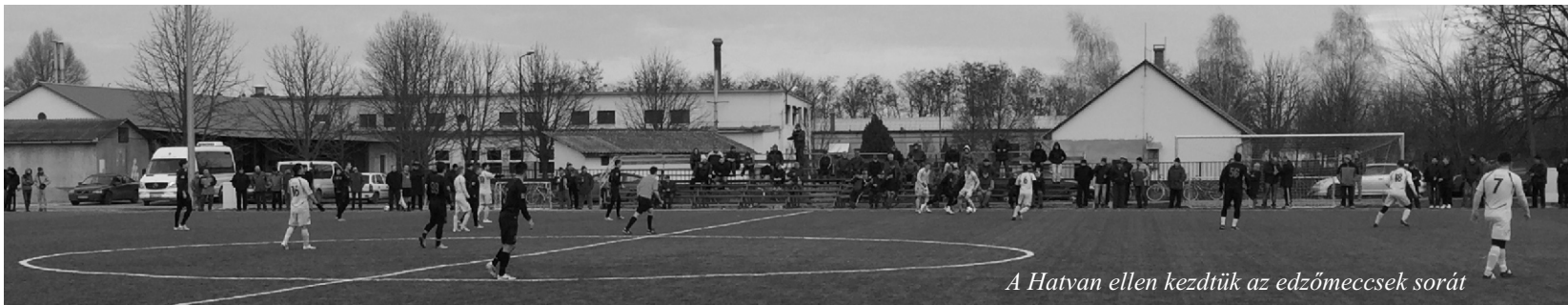
A Hatvan ellen kezdjük az edzőmeccsek sorát