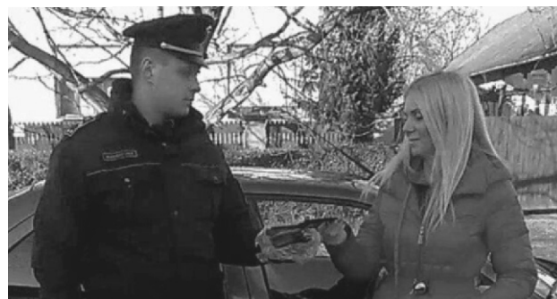
Balmazújvárosi Rendőrkapitányság Területi Balesetmegelőzési Bizottság

VIGYÁZZUNK EGYMÁSRA, ÓVJUK A MAGUNK ÉS MÁSOK ÉLETÉT, TESTI ÉPSÉGÉT!