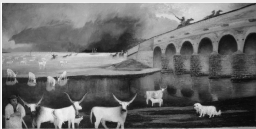
Csontváry Kosztká Tivadar: Vihar a Hortobágyon

és megörökíthetőségének örvénylő feszültsége. A festményt a nagyközönség először a Modem-ben tekintheti meg Haranghy György korai fotóművészeti remekeivel