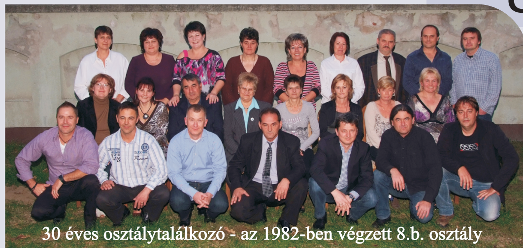
30 éves osztálytalálkozó - az 1982-ben végzett 8.b. osztály