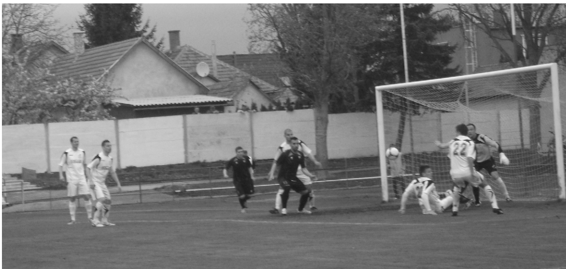
Kapu előtti kavarodás a Békéscsaba elleni találkozón.

Ellenfelünk jól megtalálta gyenge pontjainkat. Hátrányba kerültünk, amit egy szögletet követően gyorsan ledolgoztunk. A második félidőben sorsdöntő volt, hogy mi 18 méterről nem találtuk el a kaput, míg a váciak az ellentámadásból ismét megszerezték az előnyt. Ezután többet kellett kockáztatnunk, így a kinyíló védelem között kétgólosra növelték vezetésüket a vendégek. Remélem, hogy játékosaim átérzik a helyzetünket és felelősséggel tudnak gondolkodni.