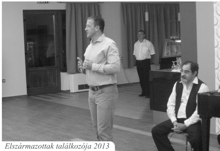
Elszármazottak találkozója 2013