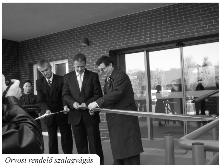
Orvosi rendelő szalagvágás