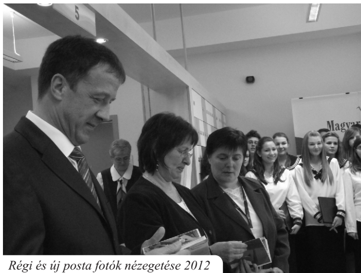
Régi és új posta fotók nézegetése 2012