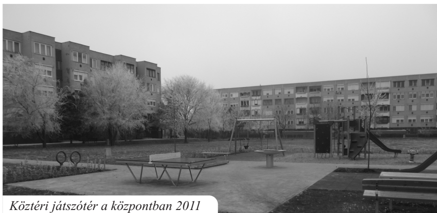
Köztéri játszótér a központban 2011