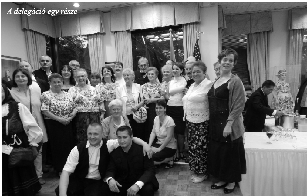
A delegáció egy része

Az amerikai emberek mellett a különböző nációnjú turista is megta-