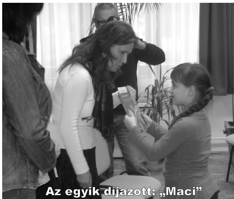
Az egyik díjazott: „Maci”

ban a négy-négy legjobbat díjaztuk. I. kategória „Juventus” – 7 éves - Postás Pali története „Maci” – 8 éves – Maci Marcsi „Dinó” – 9 éves – A veszedelmes kaland „Evicica” – 9 éves” – A cicasuli zürzavarai II. kategória „Csillágfűrt” – 10 éves – Csillámföld juci7 – 10 éves - „Apple” – kukacélet Karesz, a pilóta – 10 éves – A három repesi története Lábatlan Bolha – 10 éves – A bolha története Gratulálunk mindenkinek és köszönjük a szép munkákat!