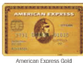
American Express Gold