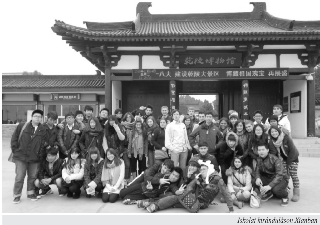
Iskolai kiránduláson Xianban

Nem ejteni szót a kínai kultúráról ebben a cikkben bűn lenne, már csak azért is, mert a világ legrégebb óta fennálló nemzetéről beszélünk. A legjobb szó rá az, hogy érdekes. Európai szemmel nézve találunk jó pár furcsa dolgot, de azt is tegyük hozzá, hogy az ember Ázsiáról beszél. A