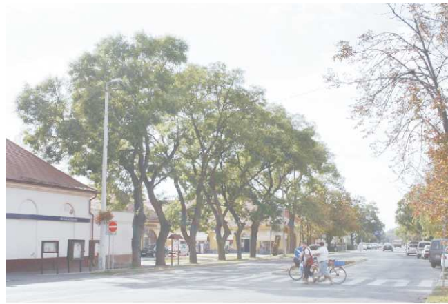
Japán akác (Veres Péter u.)