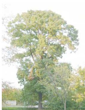
Magas kőris (Kastélypark)