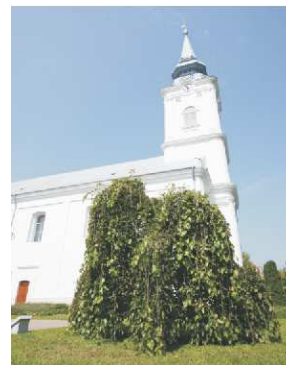
Szomorú eper (templomkert)