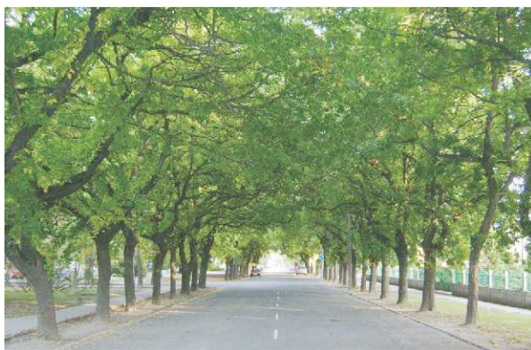
Nyugati ostorfasor (Kossuth tér)