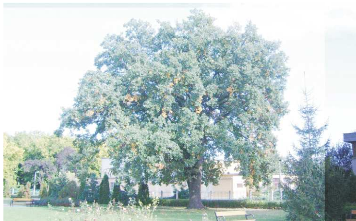
Kocsányos tölgy (templomkert)