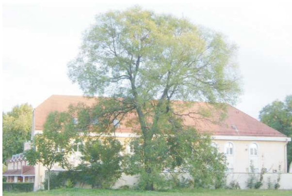
Japán akác (Kastélypark)