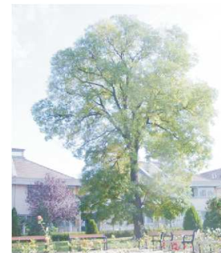
Japán akác (templomkert)