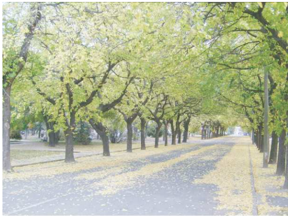
Nyugati ostorfasor (Kossuth tér)