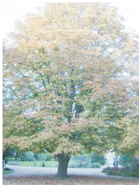
Vadgesztenye (Kossuth tér)