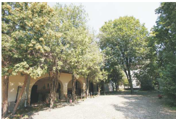
Turkesztáni szil (múzeumkert)