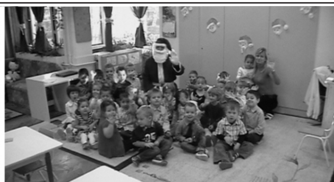
A gyerekek jó szívvel fogadták a Rendőrmikulás bácsit, akivel a jövő évben is szívesen találkozhatnak.

2011.12.11-én 20:55 óra körüli időben Balmazújváros, Erdei utcán parkoló egyik, zárt állapotú személygépkocsi ajtójának zárszerkezeteit - a magánál lévő kb. 60 cm hosszú és 4-5 cm vastagságú fa karóval - megkísérelte felfeszíteni lopási szándékkal az elkövető.