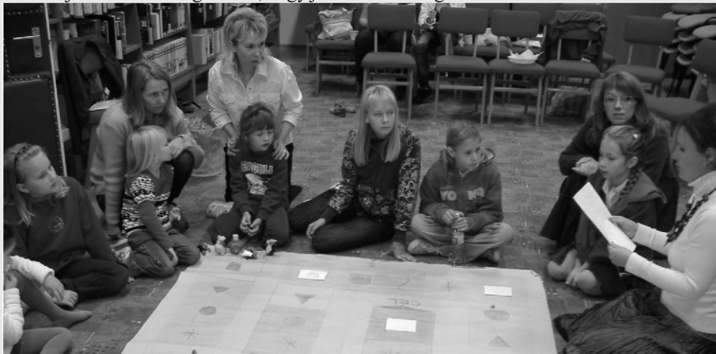
Lengyel Menyhért Városi Könyvtár dolgozó

Köszönjük minden látogatónak, hogy jelenlétével megtisztelt bennünket.