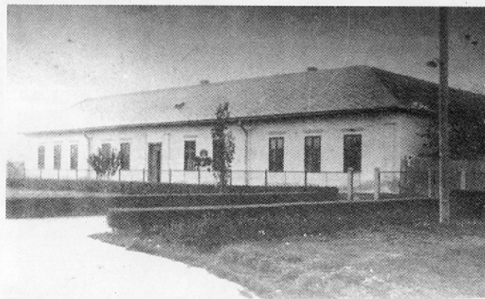
A magyar ref. elemi iskola épülete (Kossuth tér 13. sz.) 1985-ben lebontották.

A Balmazújvárosi Központi Általános Iskolába, 1966. június 18-án izgatottan lépett a virágokkal feldíszített osztályterembe harminckét gyerek a 8./b-ből. Ballagás volt, az utolsó nap, amit még együtt tölthettek. Rápillantottak a szépen felkent olajos padlóra, helyet foglaltak a kopott padosorokban, melyeken a tintásüvegből és a pacázó töltőtollból állandóan kifolyó tinta által hagyott foltok éktelenkedtek, s melyek őrizték a régmúlt idők bevéselt betűit is. A fekete tábla, amely mindig mázgas volt, most szépen csillogott, és a fekete dobkályha sem füstölgött. Meghatódva várták a diákok az utolsó csengőszót. Negyvenöt év telt el az óta. E rendhagyó találkozó alkalmával, s a mára már korosodó, de lélekben ifjú diákok gondolataiban, most meg-elevenednek a homályba vesző képek. Az akkori harminckét gyermekből ma már kilencen végleg hiányoznak. Csöndben meggyűjtanak egy szál gyertyát, s ki tudja, kinek mi kavargó a fejében. Egy pillanatra megáll, s visszafele pereg az idő.