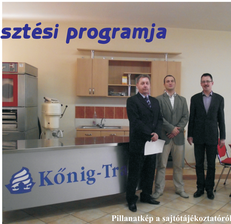
Pillanatkép a sajtótájékoztatóról

Vállalkozásuk sikere abban rejlik, hogy nem csak a gazdasági szférában elérendő eredményekre koncentrálnak, hanem az alkalmazottak testi és lelki egészségi állapotára is. Április 28-án tartott sajtótájékoztatójukon a Társadalmi Megújulás Operatív Program TÁMOP-6.1.2/A jelű sikeres pályázatukat, az abban foglalt lehetőségeket mutatták be. A 8.176.280 Ft-tal támogatott pályázati elképzelés lehetővé teszi, hogy február 1. és szeptember 30. között a dolgozók minden hónapban különféle egészségmegőrző és szemléletformáló programokon vehessenek részt. A rendezvények során a dolgozók felfrissíthetik és gyarapíthatják az egészséges életvitel vezetéséhez szükséges ismereteiket, mely az életminőségük javulásához vezethet. A program megvalósításától mind a munkaadók, mind a munkavállalók hosszú távú pozitív hatást remélnek, mely akár munkahelyi teljesítménynövekedésben is mérhető lehet.