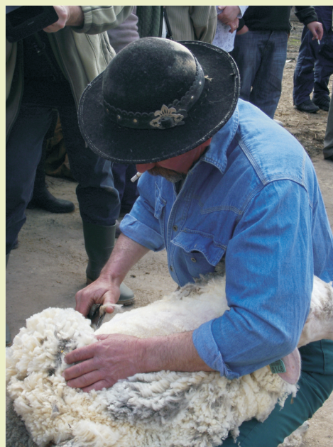
Olló a kezében, birka az ölemben...