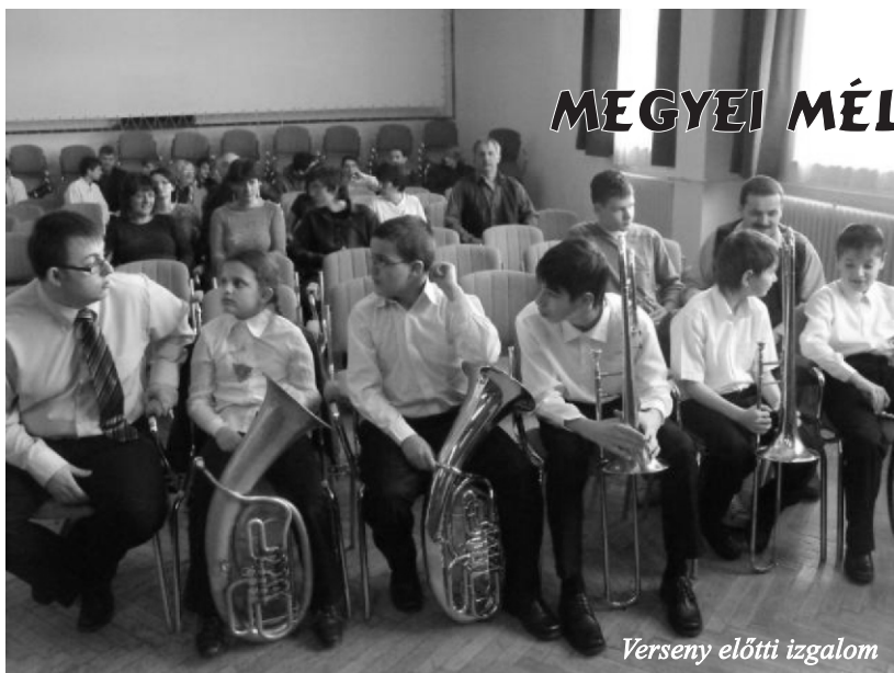
Verseny előtti izgalom