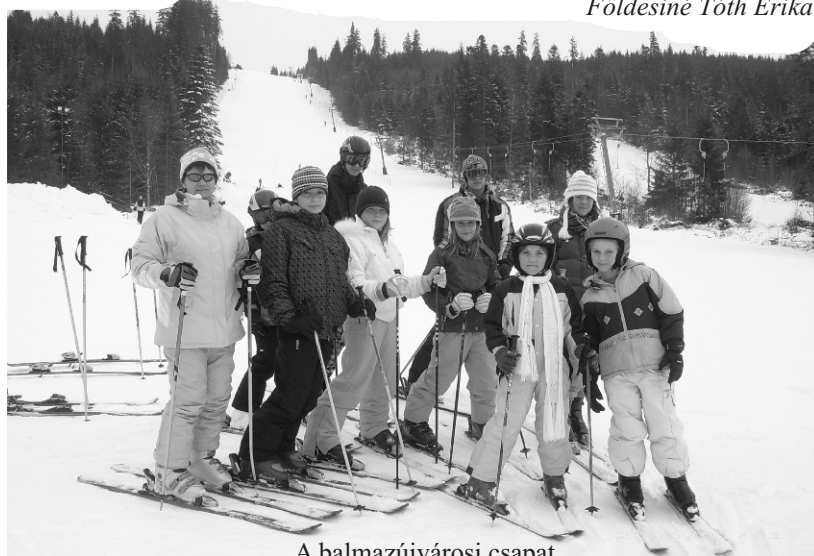
A balmazújvárosi csapat