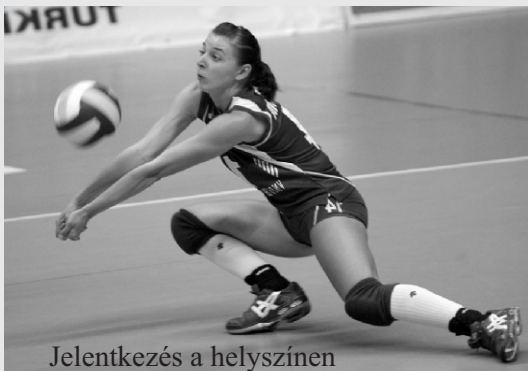
Jelentkezés a helyszínen