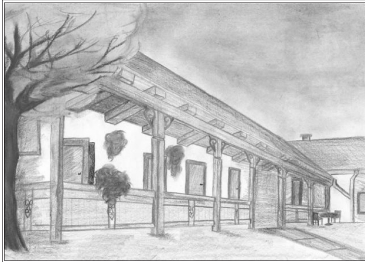
A Német Kisebbség panziójának terve

A Múzeumot úgy alakítanám ki, hogy a régi hagyományos sváb lakásokat tükrözze. A Közösségi Ház az Egyesület programjainak adna helyet. A turisták számára egyhetes turisztikai programcsomagot lehetne kialakítani.