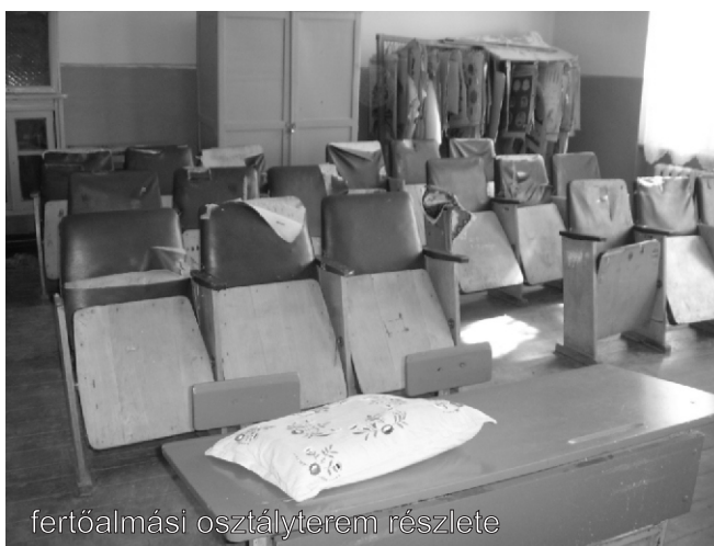
fertősalmási osztályterem részlete

Hálás köszönetüket fejezték ki a gyűjtőknek és adományozóknak azért az örömmért, azokért a sugárzó, mosolygó gyermekarcokért, amelyet az adomány okozott a diákoknak. Az ajándékokat a szeretet ünnepén osztották szét a tanulók között.