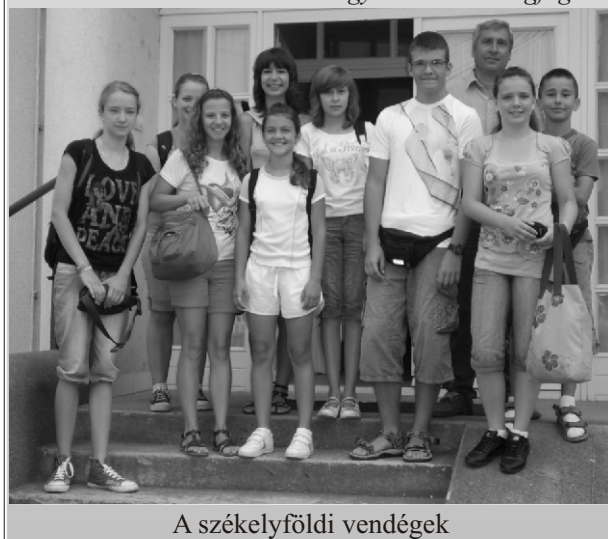
A székelyföldi vendégek