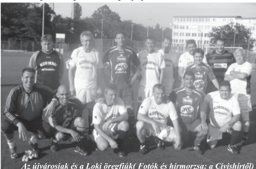
Az újvárosiak és a Loki öregfiúk (Fotók és hírmorzsa: a Cívishírtől)

Jótekonny céllal, az árvízkarosultak megsegítése érdekében rendeztek négycsapatos, igazán szórakoztató futballtornát a DEAC-sporttelep műfüves pályáján.