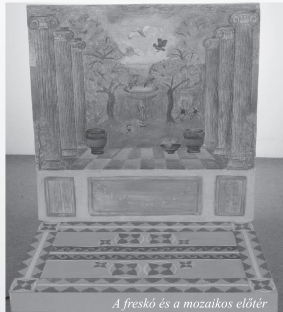
A freskó és a mozaikos előtér

Igaz ugyan, hogy a folyamatosan nehezülő feladatok menet közben többeket meghátrálásra kényszerítenek. Vannak azonban, akik végigviszik a folyamatot. Már ismerősként tűnik fel