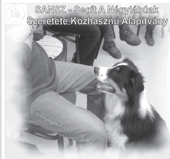
SANSZ - Segít A Négylábúak Szeretete Közhasznú Alapítvány

A Balmazújvárosi Kistérség Humán Szolgáltató Központ által működtetett szociális ellátást nyújtó alap és szakellátás szolgáltatásai (közösségi pszichiátria, támogató szolgálat, étkeztetés, házi segítségnyújtás, jelzőrendszeres házi segítségnyújtás, idősek klubja, szenvedélybetegek nappali ellátása, családsegítő szolgálat, gyermekjóléti szolgálat, idősek bentlakásos otthona) a kötelező feladatellátáson túl széles körben biztosít kulturális, szabadidős, fejlesztő foglalkozásokat, terápiákat a balmazújvárosi kistérségben élők számára, akik valamilyen ellátási formát igénybe vesznek az intézménytől. Arra törekszünk, hogy programjaink változatosak, az igényekhez és szükségletekhez igazodóak legyenek, melyet térítésmentesen vehetnek igénybe a balmazújvárosi kistérség (Balmazújváros, Egyek, Hortobágy, Tiszacsege) településein élők. Az intézményünk számos külső szakemberrel, társintézménnyel, egyesülettel, alapítvánnyal működik együtt, többek között a SANSZ közhasznú alapítvánnyal, melyet 2006 novemberében hoztak létre, azzal a céllal, hogy a Kenézy Kórház Pszichiátriai Osztályának Nappali Kórház részlegében közel 30 skizofrén betegnek kutyás terápiás foglalkozásokat