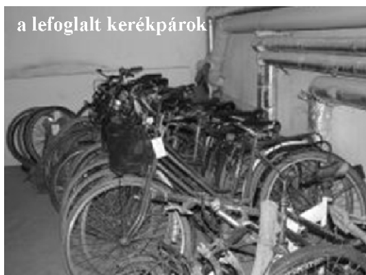
a lefoglalt kerékpárok

Összesen 20 kerékpárt foglaltak le, melyeket az elmúlt hónapokban loptak el Balmazújváros területén. Az elmúlt év második felétől elkövetett lopások gyanúsítottjait kihallgatták, mindhárman beismerő vallomást tettek. A kerékpárok többségét boltok és szórakozóhelyek elől vitték el, valamennyi esetben a lezáratlan kétkerekűeket választották.