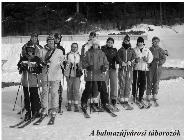
A balmazújvárosi táborozók

Február első hetében az első csoport Berettyóújfaluból és Derecskéről, a következő csoport Hajdúszoboszlóról és Balmazújvárosról érkezett, majd Hajdúbozsórményből és Hajdúnánásról utaznak a Székelyföldre. Balmazújvárosról és Hajdúszoboszlóról 18 gyerek és három kísérő érkezett az egyhetes téli táborozásra. A szállás a gyergyószárhegyi Kulturális és Művészeti Központ Scola vendégházában volt. Szárhegy a Gyergyó egyik legrégebbi települése. Az a hely, ahova szívesen visszavágyunk, nemcsak sízőként, hanem turistaként is, hiszen tanulni, látni és hallani enged a hely bárkit, bárhonnan jött is a világból.