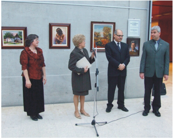
A megnyitó egy pillanata