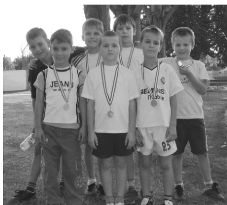
Az I. korcsoport győztes bocskais fiú csapata