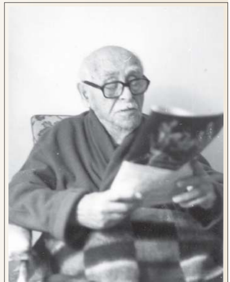
Lengyel Menyhért utolsó képe (1974. október 13.)