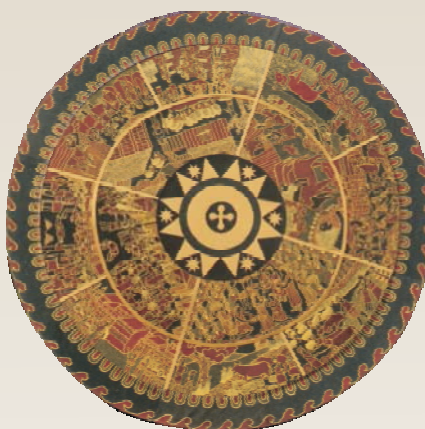
1. kép Achilleus pajzsa