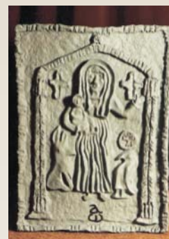
2. kép Késő-ókori dombormű