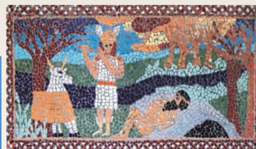
4. Kép Ió átváltozása