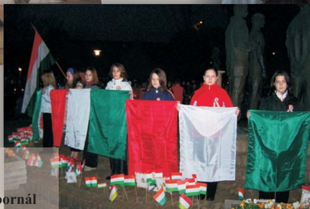
Március 15. Koszorúzás a Kossuth szobornál