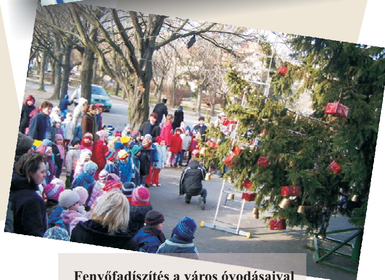
Fenyőfadíszítés a város óvodásaival