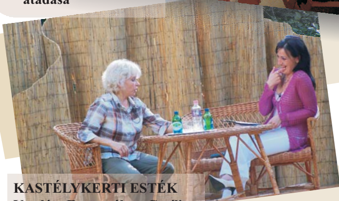
KASTÉLYKERTI ESTÉK Vendég: Esztergályos Cecília színművésznő