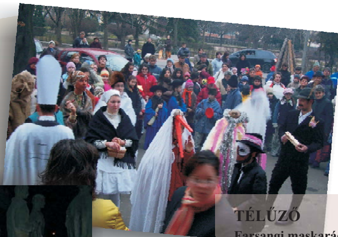
TÉLÚZÓ Farsangi maskarádé