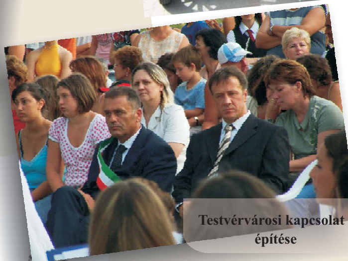
Testvérvárosi kapcsolat építése