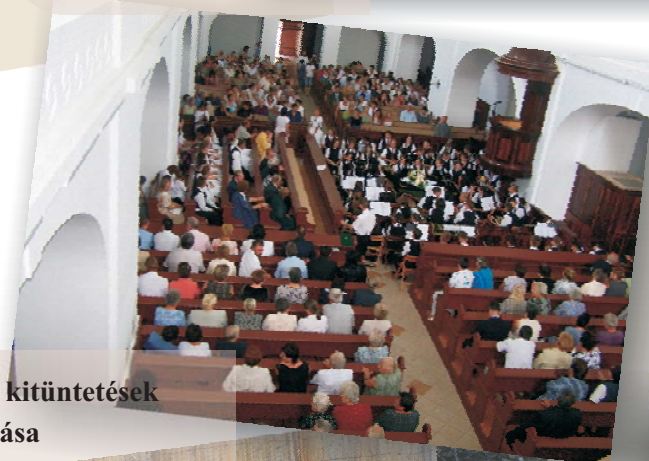
Városi kitüntetések átadása