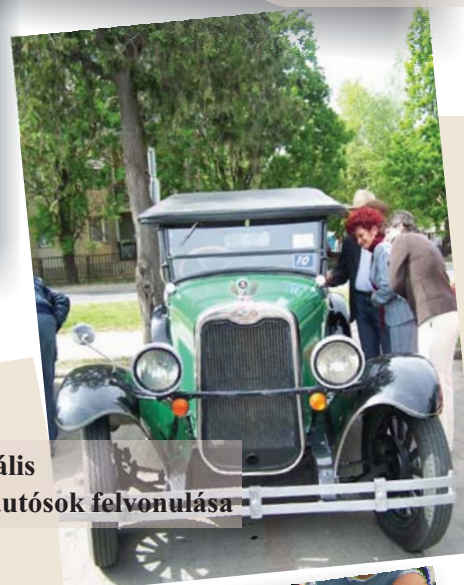
Városi Majális Veterán autók felvonulása