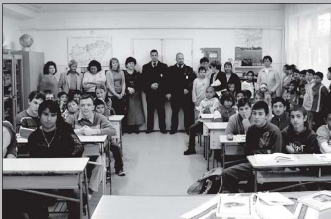
Fotó: 2007. november 5. Balmazújváros Központi és Petőfi Sándor Kistérségi Általános Iskola és Kollégium Kossuth téri épülete.

Ott a bűn-és balesetmegelőzés érdekében elbeszélgetnek a gyerekekkel, pedagógusokkal, megbeszélnek az aktuális problémákat.