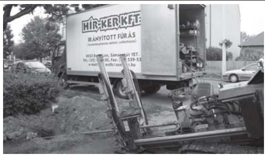
Vezetékbevezést is végző fűrógép, munka közben

A kivitelezési szerződések megkötése után már a gyakorlatban is folynak a munkák. A végleges befejezési határidő (2007. október 31. napja) néhány hetet csúszik (ez nem módosítja a tervezett, 2007. decemberi szolgáltatás beindítás időpontját!). A kivitelezés befejezését követően egy bő hónapos próbaüzem, és az internetezést, valamint a televíziózást segítő eszközök beállítása, finom hangolása következik. Ezen idő alatt várhatóan a használatba vételi engedély is megérkezik.