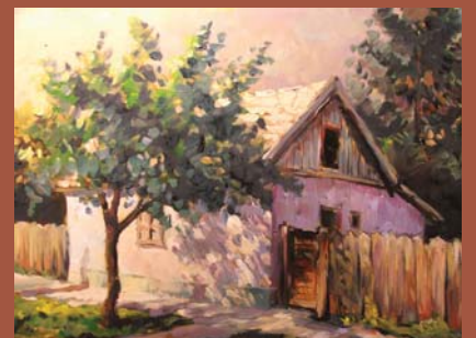
Falusi ház (30x40 cm) olaj, farost