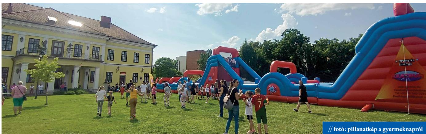
// fotó: pillanatkép a gyermeknapról