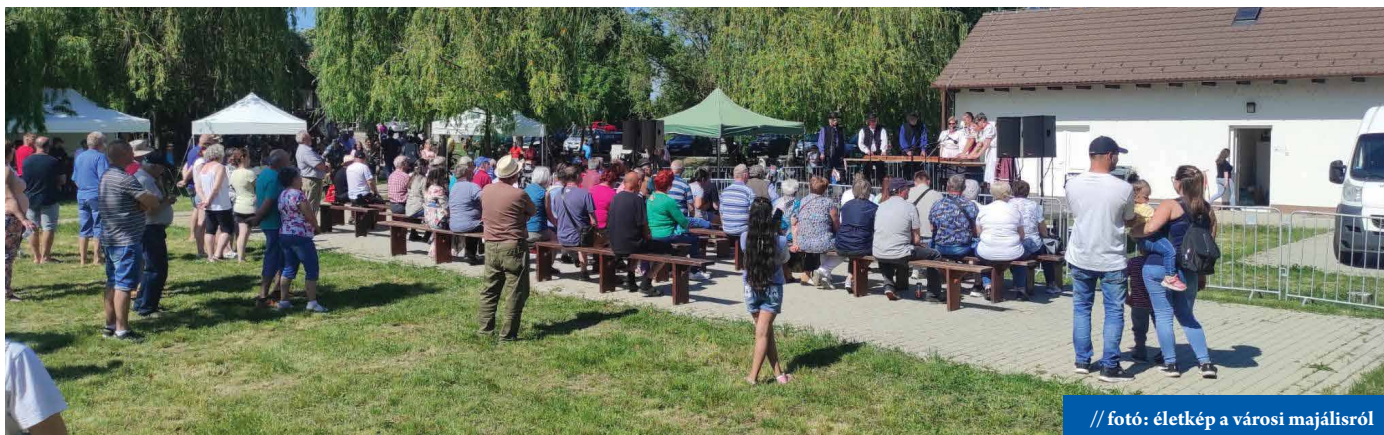
// fotó: életkép a városi majálisról