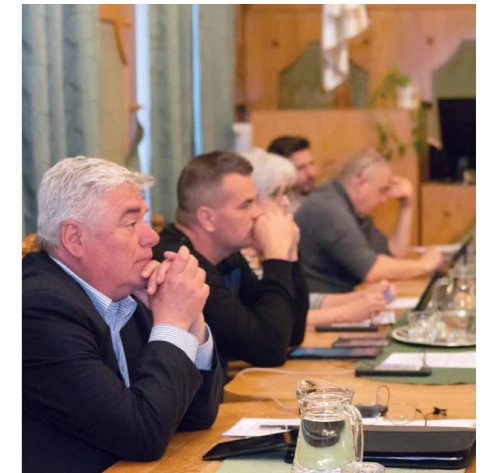
// Balmazújváros Önkormányzata

tele kell a költségvetés elfogadásához – hiába vették ki ezt a mondatot, a hat képviselő ezen a testületi ülésen mégsem fogadta el a tervezetet.