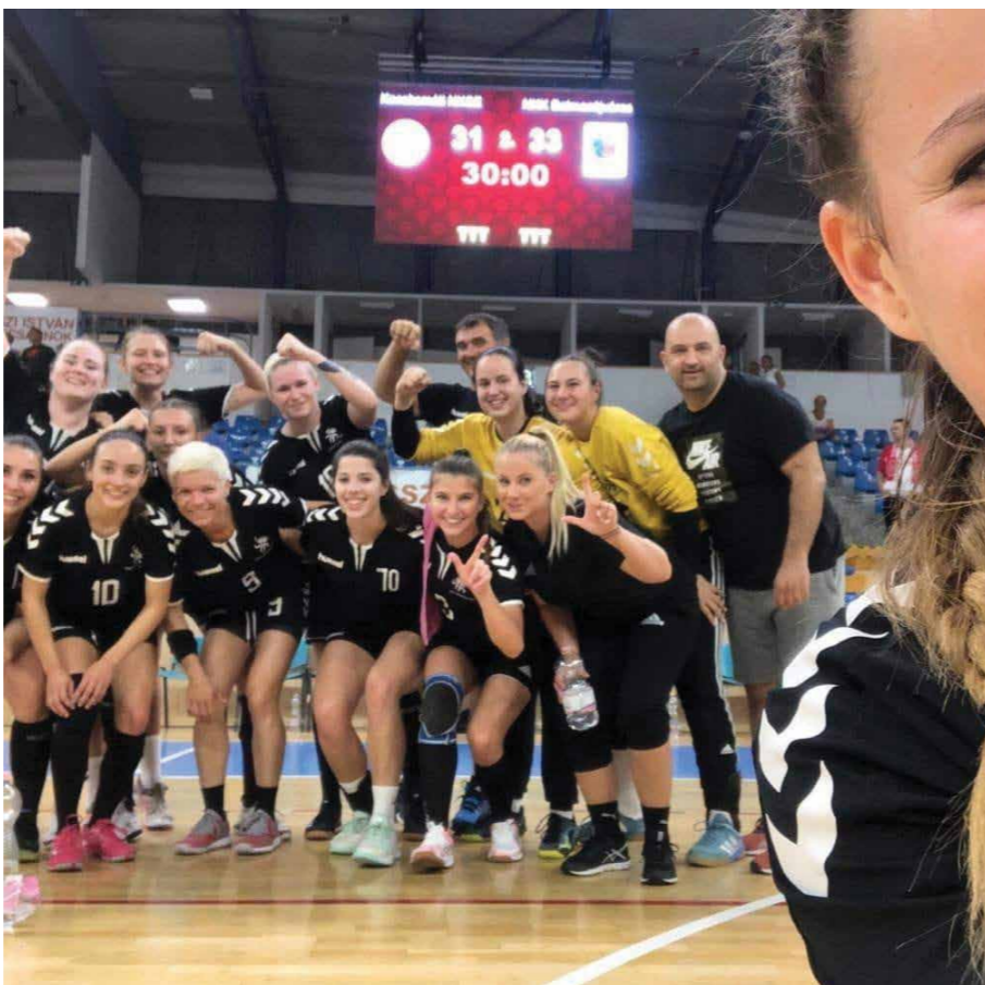
/// Kecskeméten győzelemmel kezdtük a bajnokságot