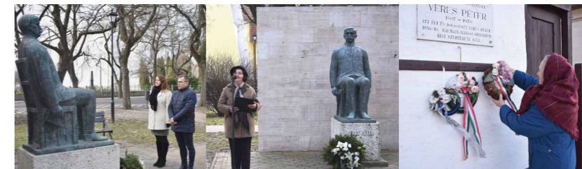
/// fotó: Balmazújváros Hivatalos Facebook oldala

Muszáj kiáltani, muszáj megmutatni és muszáj cselekedni, mert ezáltal él az ember – vallotta Veres Péter. A szegényparasztság érdekeiért fellépő népi író és politikus születésének 123. évfordulója alkalmából rendezett ünnepségen a városvezetés elhelyezte a megemlékezés koszorúit az író szobránál a központban és a szülői emlékház falán is.