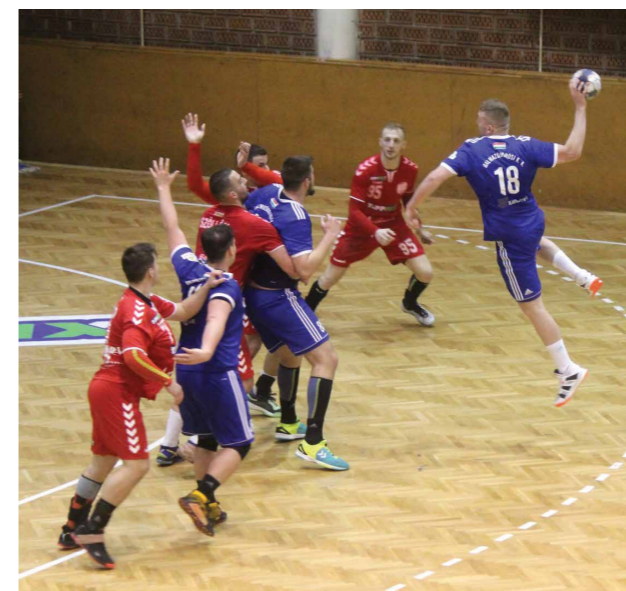
/// Fiataljaink helytálltak az NBI-es Mezőkövesdnél