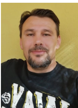
Kolozsvári Sándor 1. választókörzet