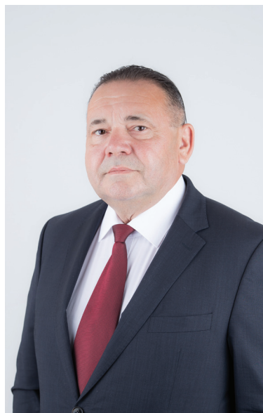
Koroknai Imre polgármesterjelölt FIDESZ-KDNP

A 2019-es önkormányzati választást 2019. október 13-án tartják Magyarországon. Immár másodjára, a képviselőket és polgármestereket 5 évre választják. Az önkormányzati választáson a megyei (fővárosi) és helyi (kerületi) önkormányzati képviselőket, a polgármestereket és a főpolgármestert, valamint a nemzetiségi önkormányzati képviselőket választják meg.